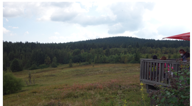
Aussicht vom Landshuter Haus