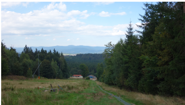
und wieder zurück zur Talstation