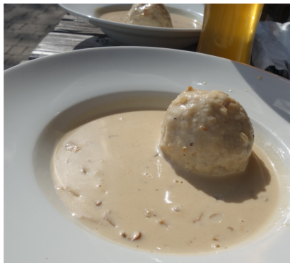
Schwammerlbrühe am Landshuter Haus - rentiert sich immer :-)