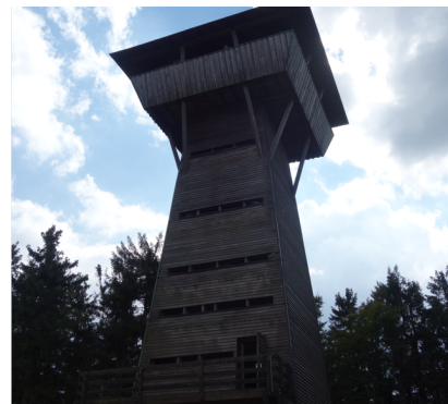
Aussichtsturm am Geißkopf